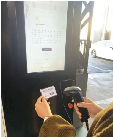
1. 掃描員工證或輸入編號