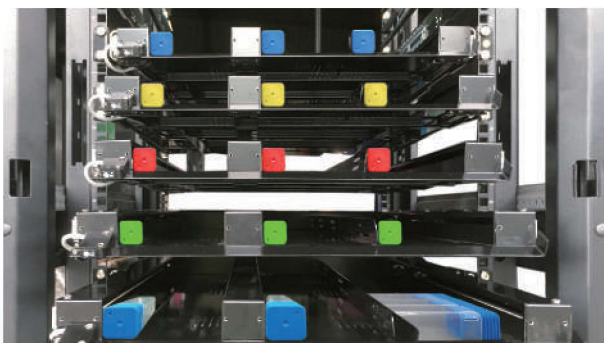
三格層 - 每格寬5-25cm